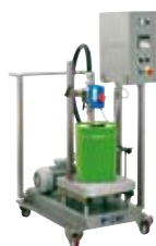
RIEMPITRICE A PESO WEIGHT FILLER