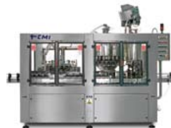
TRIBLOCCHI AUTOMATICI AUTOMATIC TRIBLOCK MACHINES