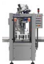
TAPPATORI CAPPING MACHINES