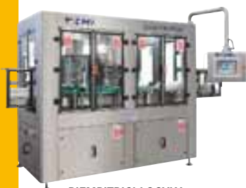
RIEMPITRICI LOGYKA SERIES LOGYKA FILLING MACHINES

riempitrici, tappatrici, dosatrici, sciacquatrici e soffiatrici.