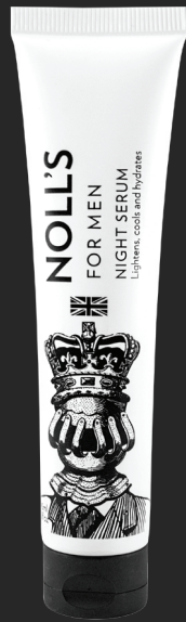
諾爾斯夜間精華液